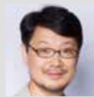
まつもと ゆきひろ

応募要件 年齢制限なし。地球上において個別連絡先が存在する方(国籍・居住地は不問)。 自薦・他薦