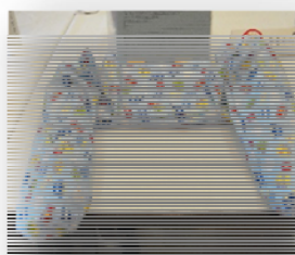
弟のためのだっこまくら