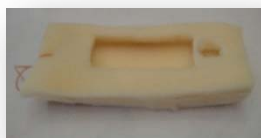
スマートフォンケース